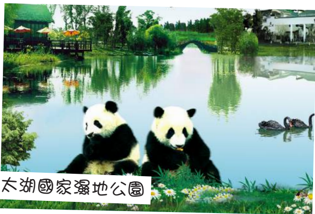
太湖國家濕地公園